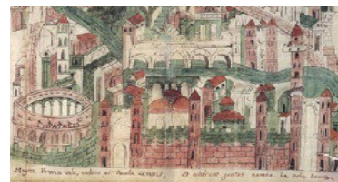
Camera Civile di Verona